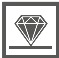
High scratch resistance