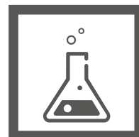
High resistance to chemicals